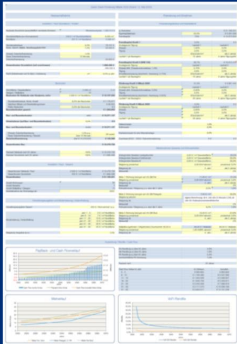
Beispiel: FB Quick Check

Die Marktveränderungen und Finanzierungspartner werden mehr umfangreiche und genaue Kalkulationen fordern. Die GSF hat mit dem FB-Quick Check ein Instrument, Projekte und deren Finanzierung zu berechnen, zu begleiten und bei Bedarf mit Gutachten zu dokumentieren, einschließlich komplexer öffentlicher Förderung. Projektentwickler und Bauherren können somit gegenüber Finanziers, Investoren und internen Gremien schärfer und sicherer kalkulieren und stärker Transparenz schaffen.